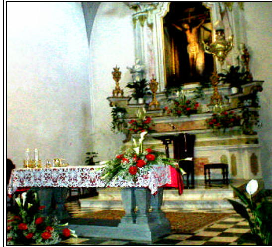
“il “cuore” della domenica nella nostra chiesa

DALLAMESSADI OGGI – “Disse Gesù ai suoi discepoli: Non temete, piccolo gregge, perché al Padre vostro è piaciuto di darvi il suo Regno ” (Luca 12,32) - “La Fede è fondamento delle cose che si sperano e prova di quelle che non si vedono” (Ebrei 11)