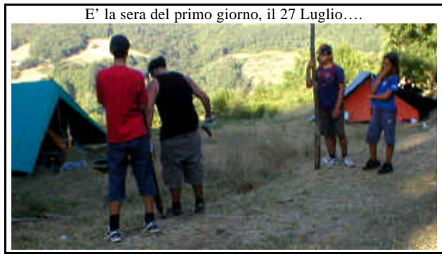
27 Luglio, prima sera: ecco una "Squadriglia" di ragazze, di Guide che dopo aver montato le loro tende, lavorano ancora

Da quando pochi anni fa abbiamo dovuto interrompere la vita del Gruppo Scout, soprattutto per mancanza di "capi-educatori" che, divenuti adulti, per motivi di lavoro hanno lasciato questo incarico, ma la tradizione scout è continuata di anno in anno, perché la Parrocchia, nel tempo, aveva predisposto, attrezzato e preparato un "luogo" molto bello e adatto ai "campi scout" che poi nel tempo ha accolto "gruppi" che sono venuti da varie parti d'Italia. Questa località a Castelnuovo è conosciuta da tutti: si chiama "Santa Maria a Poggi Lazzaro", conosciuta, usata e apprezzata anche per altre attività a carattere giovanile e familiare della