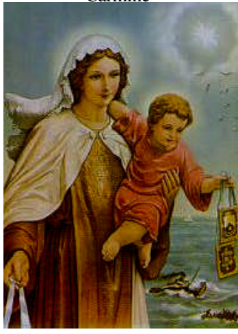
Immagine della "Madonna del Carmine"

Lunedì 16 Luglio, cioè domani, ricorre la "MADONNA DEL CARMELO" o del "CARMINE". Domenica scorsa non su questo non scrivemmo niente, ma durante la settimana, insieme alla recita del Rosario, e alla S. Messa, è stata fatta tutte le sere "LA NOVENA" in preparazione.