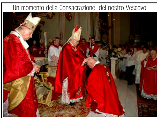
Un momento della Consacrazione del nostro Vescovo

"I vescovi, quali successori degli apostoli, ricevono dal Signore, cui è data ogni potestà in cielo e in terra, la missione d'insegnare a tutte le genti e di predicare il Vangelo ad ogni creatura, affinché tutti gli uomini, per mezzo della fede, del battesimo e dell'osservanza dei comandamenti, ottengano la salvezza.