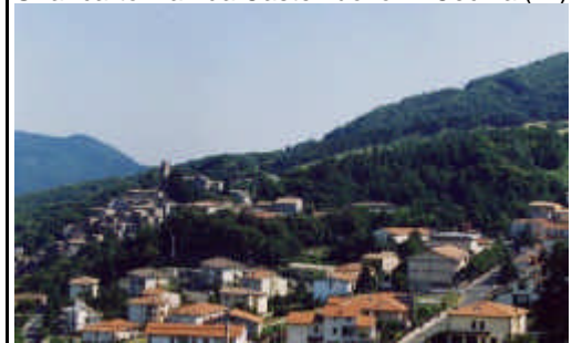
Una "cartolina" da Castelnuovo V. Cecina (PI)