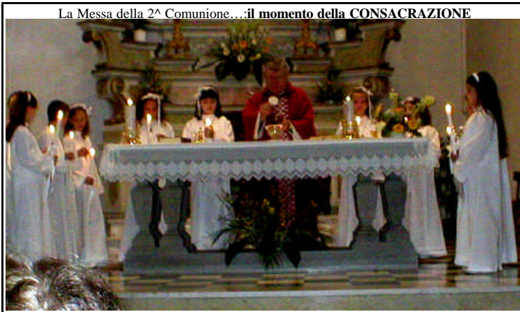
La Messa della 2ª Comunione...il momento della CONSACRAZIONE

Nel sacramento dell'Eucaristia Gesù ci mostra in particolare la verità dell'amore, che è la stessa essenza di Dio. È questa verità