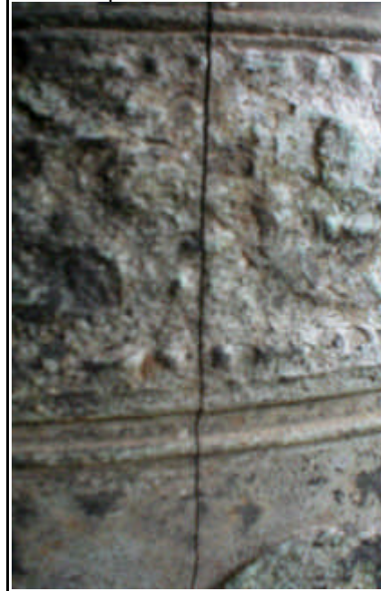
Ecco un particolare della rottura della campana...

Dopo la pioggia del giorno e tanti nuvoli minacciosi, poi è stato premiato il nostro ottimismo e la nostra speranza. Siamo andati "al Piano" per una bella strada di recente asfaltata dall'ENEL e rifinita e ben sterpata ai lati con cura per una buona iniziativa del nostro Comune, i bambini della Prima Comunione col i loro familiari e diversa gente si sono ritrovati a rendere omaggio alla Madonna e a celebrare la S. Messa e poi la processione sul piazzale ben tenuto e