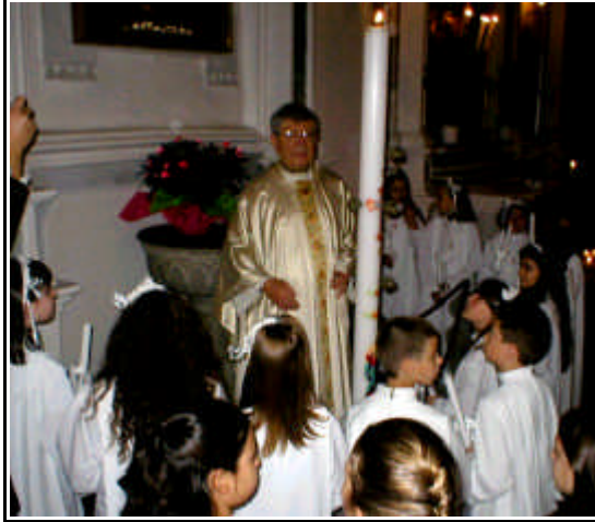
Prima Comunione: al Battistero.....

Osserva la "Pentecoste" nella "vetrata" della nostra chiesa, presso l'altare di S. Michele