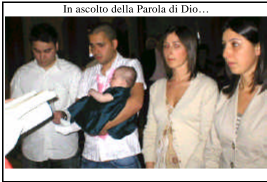
In ascolto della Parola di Dio...

Come la vita umana , per crescere e diventare adulta, ha bisogno della cura amorosa e premurosa dei