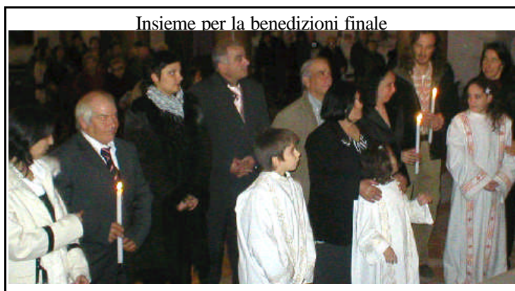
Insieme per la benedizioni finale