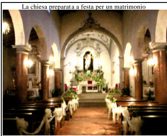
La chiesa preparata a festa per un matrimonio

La nostra parrocchia celebra due “avvenimenti particolari” e significative, proprio di novembre: il 9, la festa del SS. Salvatore; il 14 la festa della “dedicazione” o “consacrazione” della chiesa. La festa del SS. Salvatore è ben radicata nella tradizione parrocchiale e paesana; la memoria della “Consacrazione della chiesa”, è stata riscoperta solo pochi anni fa in un antico manoscritto. Anzi in tale manoscritto si dice che fu festeggiata fino al 1744 e poi tale celebrazione fu abbandonata.