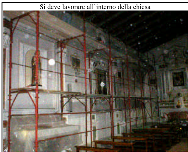
Si deve lavorare all'interno della chiesa

***Se coloro che ci vorranno aiutare, lo faranno quando potranno e quando se lo ricorderanno, io per primo e la Parrocchia, gliene saremo grati veramente don secondo