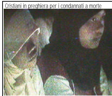
Cristiani in preghiera per i condannati a morte