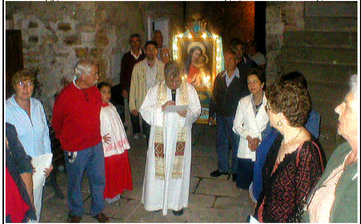
Foto suggestiva della Processione in Borgo, venerdì 25 Agosto

****LA PROCESSIONE DELLA MADONNA, IN BORGO è riuscita bene: siamo contenti