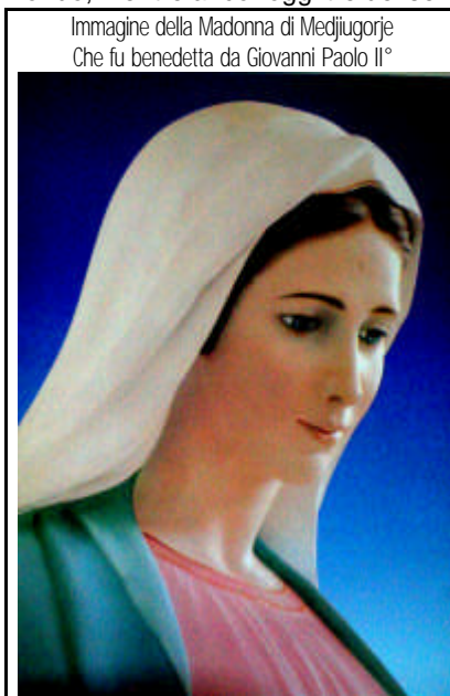
Immagine della Madonna di Medjugorje Che fu benedetta da Giovanni Paolo II°

Nel giugno del 1981 sei ragazzi di un villaggio dell'ex Jugoslavia affermarono di aver visto la Madonna.. E' una storia iniziata il 25 giugno 1981, che da allora ha richiamato nel cuore della ex Jugoslavia milioni di persone da tutto il mondo, mentre ancor oggi tre dei sei veggenti affermano di avere le «visioni» ogni sera, ovunque si trovino. Da allora