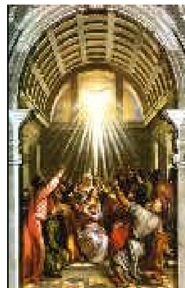
L'ascolto della Parola di Dio

Oggi le offerte che si raccolgono, vanno per questo scopo. ( A pag. 2 il Messaggio del Vescovo )