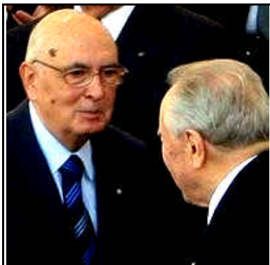
Giorgio Napolitano , qui insieme al "vecchio" Presidente Carlo Azeglio Ciampi, sarà il nuovo Presidente della Repubblica