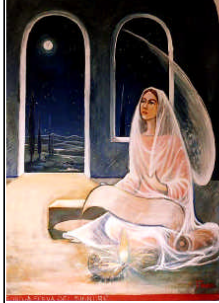
L'Ave Maria del "Sì" (= l'Annunciazione)

Il Santo Padre ha appreso le notizie con profondo dispiacere, poiché un atto così rilevante per la vita della Chiesa, com'è un'ordinazione episcopale, è stato compiuto in entrambi i casi senza rispettare le esigenze della comunione con il Papa. Si tratta di una grave ferita all'unità della Chiesa. Secondo le informazioni ricevute, Vescovi e sacerdoti sono stati sottoposti, da parte di organismi esterni alla Chiesa (= autorità comuniste ), a forti pressioni e a minacce, affinché prendessero parte a ordinazioni episcopali che, essendo prive del mandato pontificio, sono illegittime ed, inoltre, contrarie alla loro coscienza. Si è, quindi, di fronte a una grave violazione della libertà religiosa. La Santa Sede ribadisce la necessità del rispetto della libertà della Chiesa e dell'autonomia delle sue istituzioni da qualsiasi ingerenza esterna, e si augura, perciò, vivamente che non vengano ripetuti tali inaccettabili atti di violenta e inammissibile costrizione, e ha ribadito la propria disponibilità a un dialogo onesto e costruttivo con le competenti Autorità