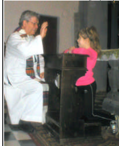
Un momento della Confessione (per prova)

Il giorno della prima Confessione coincide, per puro caso, con la "festa" della DIVINA MISERICORDIA. Non +è una festa ufficiale della Chiesa e non fa parte del "Calendario Liturgico", però si è "afferzata" a livello devozionale soprattutto da quando il Papa Giovanni Paolo II° proclamò "SANTA" Suor Faustina, riconoscendo così l'autenticità delle "rivelazioni private" fatte da Gesù alla santa suora. LA "DIVINA MISERICORDIA" è l'amore di Dio che,