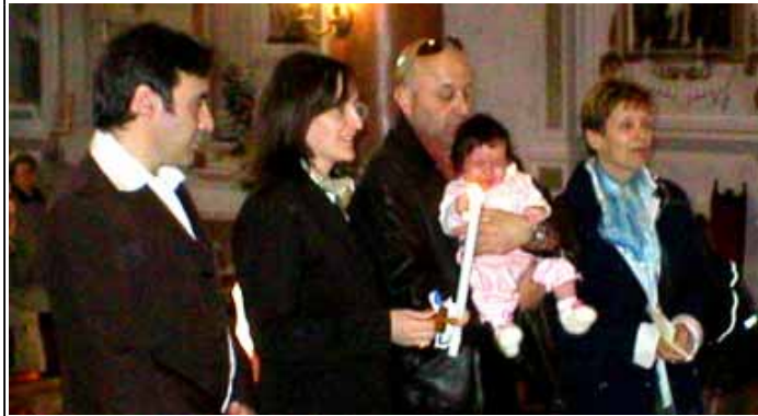
La Benedizione finale davanti all'altare