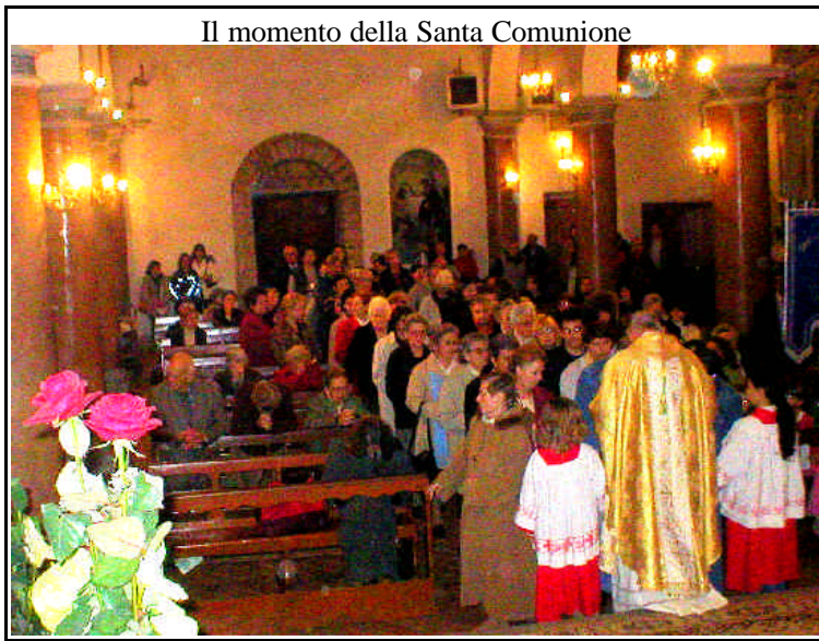
Il momento della Santa Comunione

Patriarchi e ai Profeti, non cessa di parlare alla Chiesa e, per mezzo di questa, al mondo. La Chiesa non vive di se stessa ma del Vangelo e dal Vangelo sempre trae orientamento per il suo cammino. La Costituzione conciliare “Dei Verbum” ha impresso un forte impulso alla valorizzazione della Parola di Dio, da cui è derivato un profondo rinnovamento della vita della Comunità ecclesiale, soprattutto nella predicazione, nella catechesi, nella teologia, nella spiritualità e nelle relazioni ecumeniche. È infatti la Parola di Dio che, per l'azione dello Spirito Santo, guida i credenti verso la pienezza della verità. Gli Apostoli e i loro successori, i Vescovi, sono i depositari del messaggio che Cristo ha affidato alla sua Chiesa, perché fosse trasmesso integro a tutte le generazioni” (Benedetto XVI)