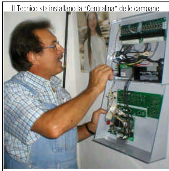
Il Tecnico sta installando la “Centralina” delle campane

quasi tutte le scuole, ormai propongono a chi non fa religione soltanto l'“uscita anticipata! L'alternativa non è più tra due scelte educative, ma tra l'educazione e il disimpegno: è chiaro che un ragazzo o una ragazza di 14 anni sceglie il disimpegno. Vorrei vedere se si dicesse che l'italiano o la matematica sono materie facoltative, quanti ragazzi resterebbero in classe!”. Per spiegarsi come mai la Toscana e Firenze siano messe peggio rispetto al resto d'Italia bisognerebbe fare delle valutazioni storiche, sociologiche. Io posso dire che si notano molti pregiudizi da sfatare. Oggi abbiamo insegnanti qualificati, preparati, apprezzati anche nell'ambiente scolastico. Qualcuno pensa che sia un'ora di...catechismo o di proselitismo: invece è un percorso culturale di alto livello”. **** E il ruolo delle famiglie in questa scelta? “A volte i genitori rinunciano troppo facilmente a stimolare i ragazzi verso una scelta più impegnativa: su altre scelte i ragazzi vengono indirizzati... Perché Su una scelta così importante no? Dispiace che a volte la scelta sia fatta dai ragazzi in modo superficiale, per motivi futili: perché il mio amico o la mia amica non ci viene, perché la ragazzina o il ragazzino che mi piace non la sceglie !..... (segue a pag. 2)