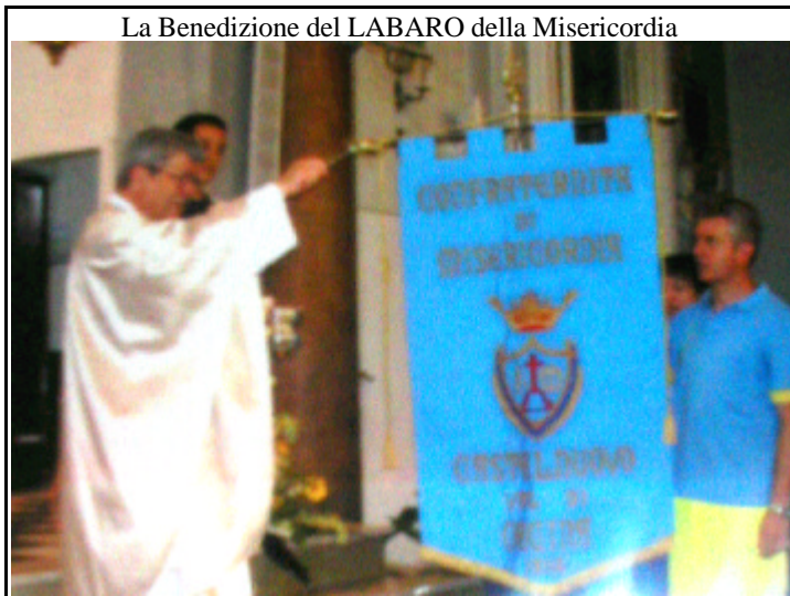
La Benedizione del LABARO della Misericordia