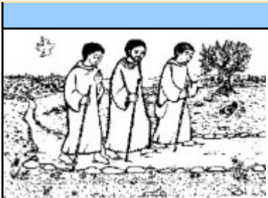
DIOCESI DI VOLTERRA

Con i bambini della Prima Comunione, riceviamo anche noi Gesù nella Santa Comunione.