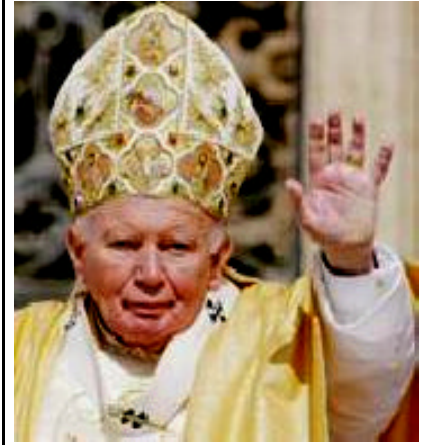
Davanti all'altare, la Benedizione alla mamma, al babbo e a tutti