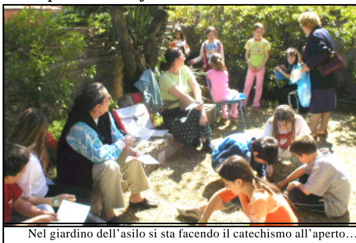
Nel giardino dell'asilo si sta facendo il catechismo all'aperto...

Si sono ritrovati giovedì scorso, hanno parlato di tutti questi problemi e hanno stabilito anche QUANDO FARE IL CATECHISMO ogni settimana, ed è venuto fuori questo "calendario" e questi "orari":