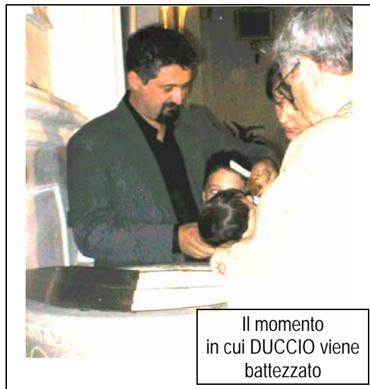
Il momento in cui DUCCIO viene battezzato

"Festa" vuol dire provare una grande gioia per un motivo particolare: la "festa" vera è soprattutto il giorno del Signore, la domenica, che ha per motivo dominante ha la risurrezione di Gesù.