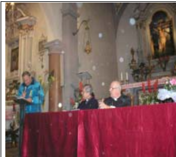
L'intervento del Governatore della Misericordia