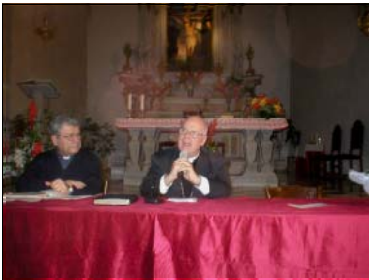
Il Vescovo parla al termine dell'Assemblea Parrocchiale