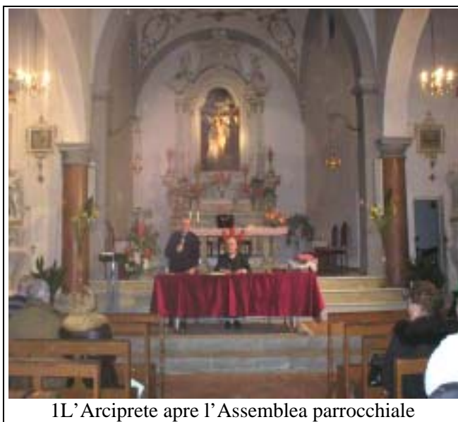
IL' Arciprete apre l'Assemblea parrocchiale

Una parrocchia che celebra i trent'anni del suo Consiglio Pastorale deve essere per forza una parrocchia viva, ha detto il Vescovo, però ora è il momento di diventare una parrocchia più missionaria, missionaria al suo interno, tra la