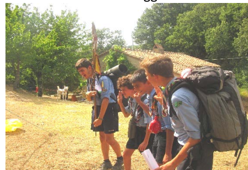
Santa Maria a Poggi' Lazzaro

Proprio per questo, il Gruppo sente il dovere di ringraziare la Fondazione Cassa di Risparmio di Volterra per aver contribuito a questo importante progetto. - (Agesci – Gruppo Scout Alta Val di Cecina 1) don Secondo