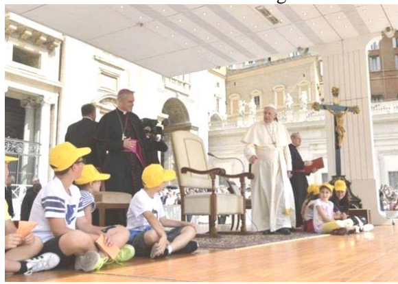
Ragazzi di Capannoli vicini al Papa in Piazza S. Pietro il 13 Giugno 2018

(Il Papa aveva prima preso per mano alcuni ragazzi “col cappellino giallo” e li aveva portati vicini a sé mentre stava per parlare: al termine ha detto che quei ragazzi appartenevano ad un gruppo della Scuola di Ponsacco in provincia di Pisa)